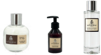
Linnenparfum Linnenextract Huisparfum